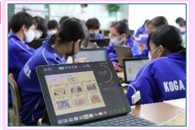
▲ICT機器を効果的に活用した授業