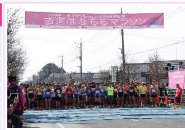
▲古河市はなももマラソン