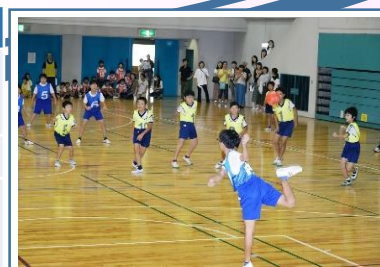
▲子ども会活動の様子