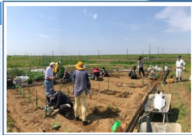
▲市民大学「市民農園ではじめての野菜作り」