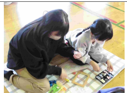
11月20日(木) 3年生親子フォトフレーム作り5, 6時間目 参加者58名 学校体育館

親子でじゃんけん列車を楽しみました。親子で手をつないで、体育館を回りました。最後に記念写真を撮りました。