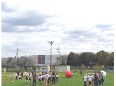
9月22日(木) 4年生親子スポーツ大会5, 6時間目 参加者51名 学校校庭 クラス対抗の大玉転がし。休憩中にはお家の人への「肩たたきタイム」。その後、ドッジボール大会へ。親子で笑顔あふれる、ふれあいの時間になりました。

親子でフォトフレーム作りに取り組みました。思い出の写真を見つめながら、飾り付けを工夫して、親子で完成させました。