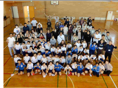
10月23日(木) 5年生親子ドッジボール大会5, 6時間目 参加者57名 学校体育館

親子でチームを編成し、ドッジボール大会を行いました。みんな笑顔があふれ、最後に記念写真を撮りました。