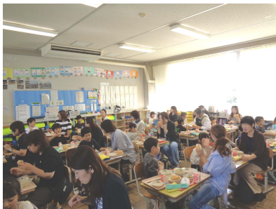
10月17日(金) 1年生親子給食 4時間目、給食 参加者45名 1年生各教室