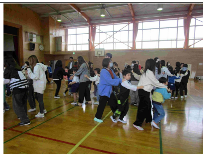
10月22日(水) 2年生親子じゃんけん列車5, 6時間目 参加者47名 学校体育館

親子でじゃんけん列車を楽しみました。親子で手をつないで、体育館を回りました。最後に記念写真を撮りました。