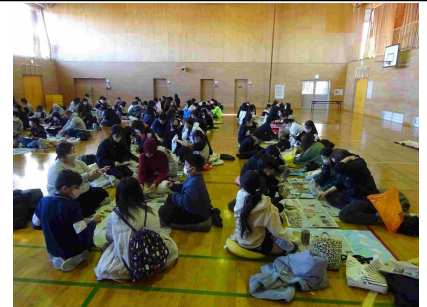
12月12日(金) 6年生親子陶芸教室5, 6時間目 参加者60名 学校体育館

親子でチームを編成し、ドッジボール大会を行いました。みんな笑顔があふれ、最後に記念写真を撮りました。