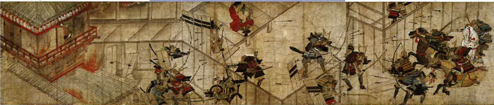
結城合戦絵詞(部分) 重要文化財 国立歴史民俗博物館所蔵