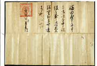
足利義氏過所 天正3年3月18日 古河市指定文化財 福田家文書