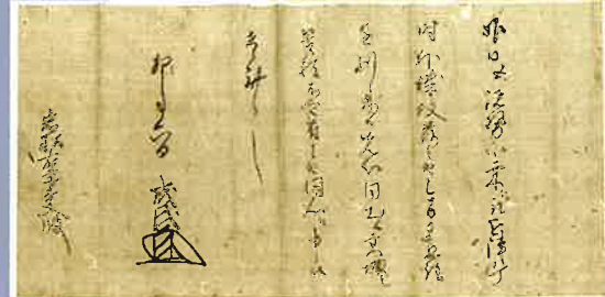
足利成氏書状 正木文書

室町幕府を開いた足利尊氏は、鎌倉に自らの子である基氏を派遣して東日本を抑える要とした。そうした経緯で鎌倉公方が成立する。その五代目となる足利成氏は、自身の血統の正当性をよりどころに室町將軍家と抗争することになり、享徳四年(一四五五)、鎌倉を出て古河へその拠点を移した。いわゆる古河公方の誕生である。成氏は、その後鎌倉に戻ることなく、古河のまちを政治的、文化的な都市空間に整備した。その後一三〇年にわたり存在した古河公方の歴史を、残された文化財から俯瞰して紹介する。