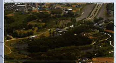
古河公方館跡 茨城県指定史跡 古河公方公園内

JR宇都宮線・湘南新宿ライン・上野東京ライン 古河駅 徒歩15分 東武日光線 新古河駅 徒歩20分 開館時間 9:00~17:00(入館は16:30まで) 休館日 10月10日・16日・19日・20日・23日 27日・30日 11月6日・13日・20日・24日 入館料 一般 400円 小中高生 100円 団体(20名以上) 300円