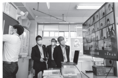
オンライン授業の様子

また、市内農業者における新型コロナウイルス感染症による影響を確かめるために、認定農業者の会長さんが経営する農場を視察させていただきました。