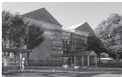
改修工事が始まった古河庁舎

問 工事対象外建物の公用車駐車場等にも、さびが出ていて危険である。また、庁舎内壁やブラインド、カーテン等の老朽化も目立つが今後の対応について伺う。