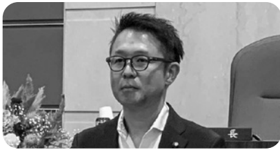
立川 徹 議員