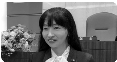
佐々木 里加 議員

答（副市長） 4月にカーボンニュートラル推進室を設置した。主な取り組みは、啓発活動として市内中学校にて講座を実施し、企業向けに、工業団地のグリーン化に向けたモデル事業を予定している。カーボンニュートラルへの取り組みは、情報等の的確な把握と、実行が課題である。