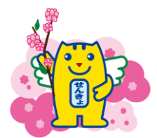
はなもめいすいくん