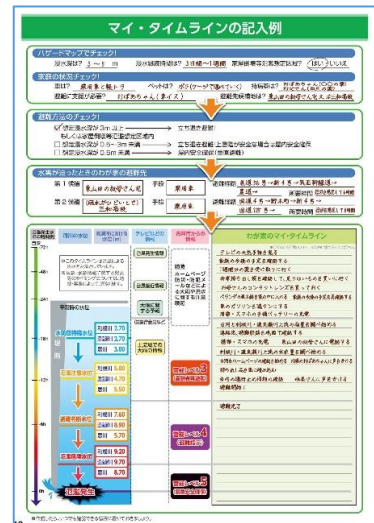
マイ・タイムラインの作成例

ハザードマップ・ガイドブックを活用することで、自分や家族に合った、実効性のある「マイ・タイムライン(自分専用の避難行動計画)」を作成できるようになります。