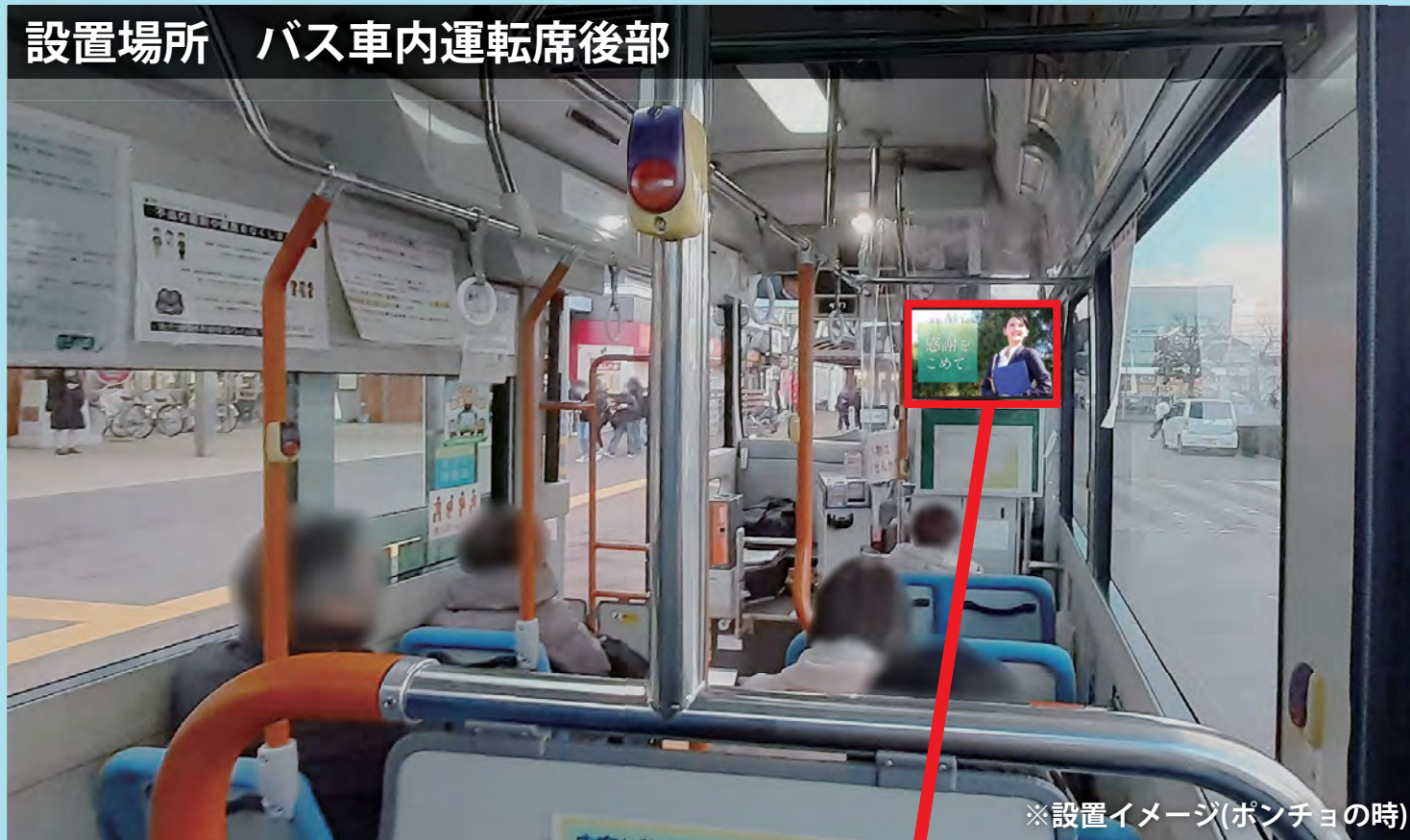
※設置イメージ(ポンチョの時)