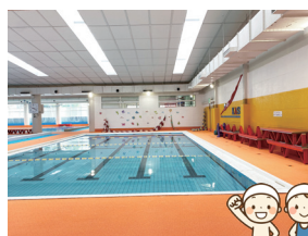
古河あかやま スイミングスクール