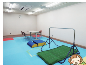
放課後等デイサービス

作業療法士・理学療法士・言語聴覚士や保育士による個別の関わりを通し、運動や学習、ソーシャルスキル、言語面のサポートをします。