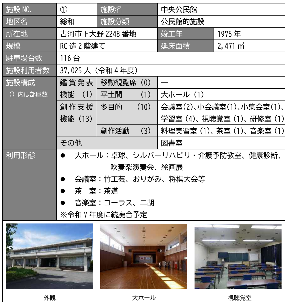
表 3.3 施設概要（中央公民館）

調査した 15 の文化施設について、施設ごとの施設構成や利用形態を示す。 なお、諸室名称は、古河市公共施設適正配置基本計画に準じている。