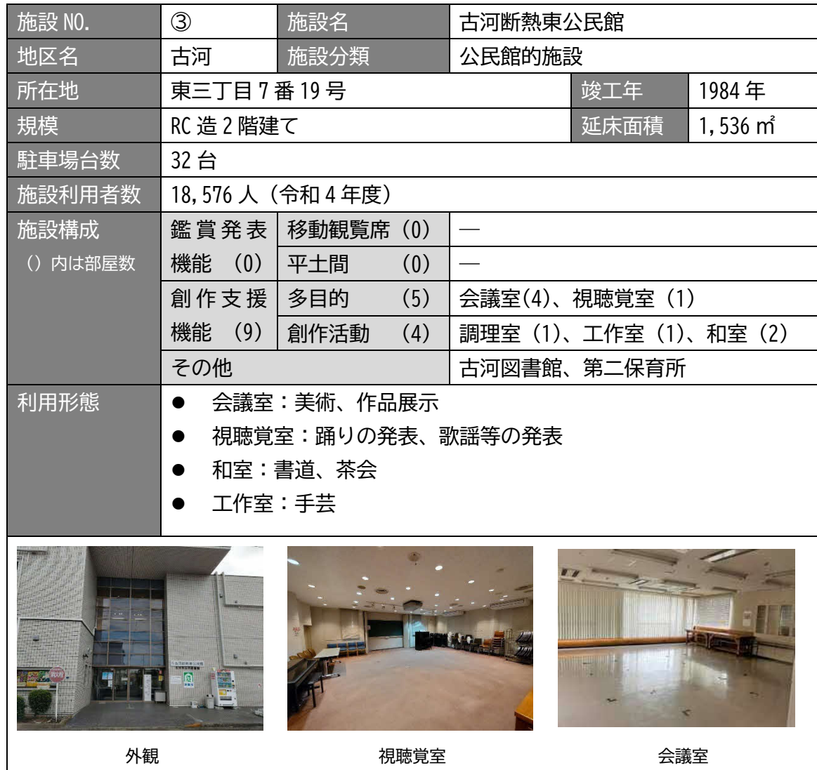
表 3.5 施設概要（古河断熱東公民館）