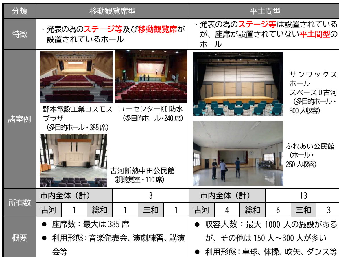
表 3.1 既存文化施設の鑑賞・発表機能