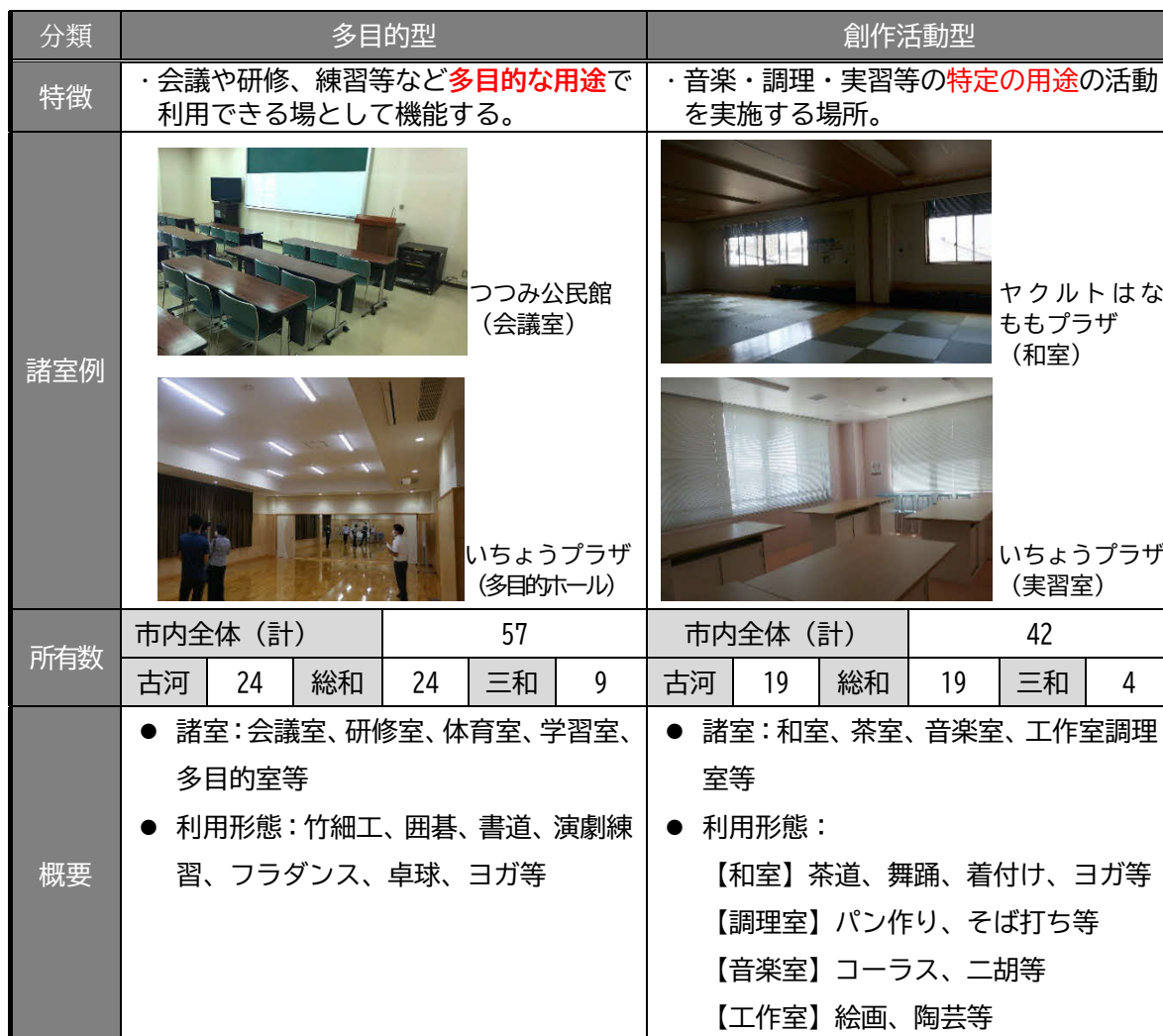
表 3.2 既存文化施設の創造支援機能