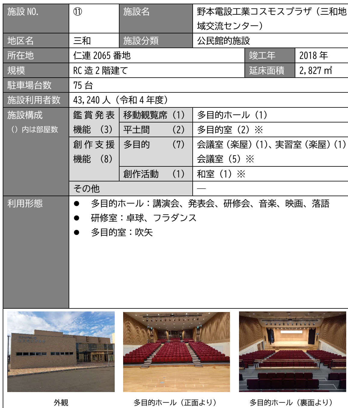
表 3.13 施設概要（野本電設工業コスモスプラザ）