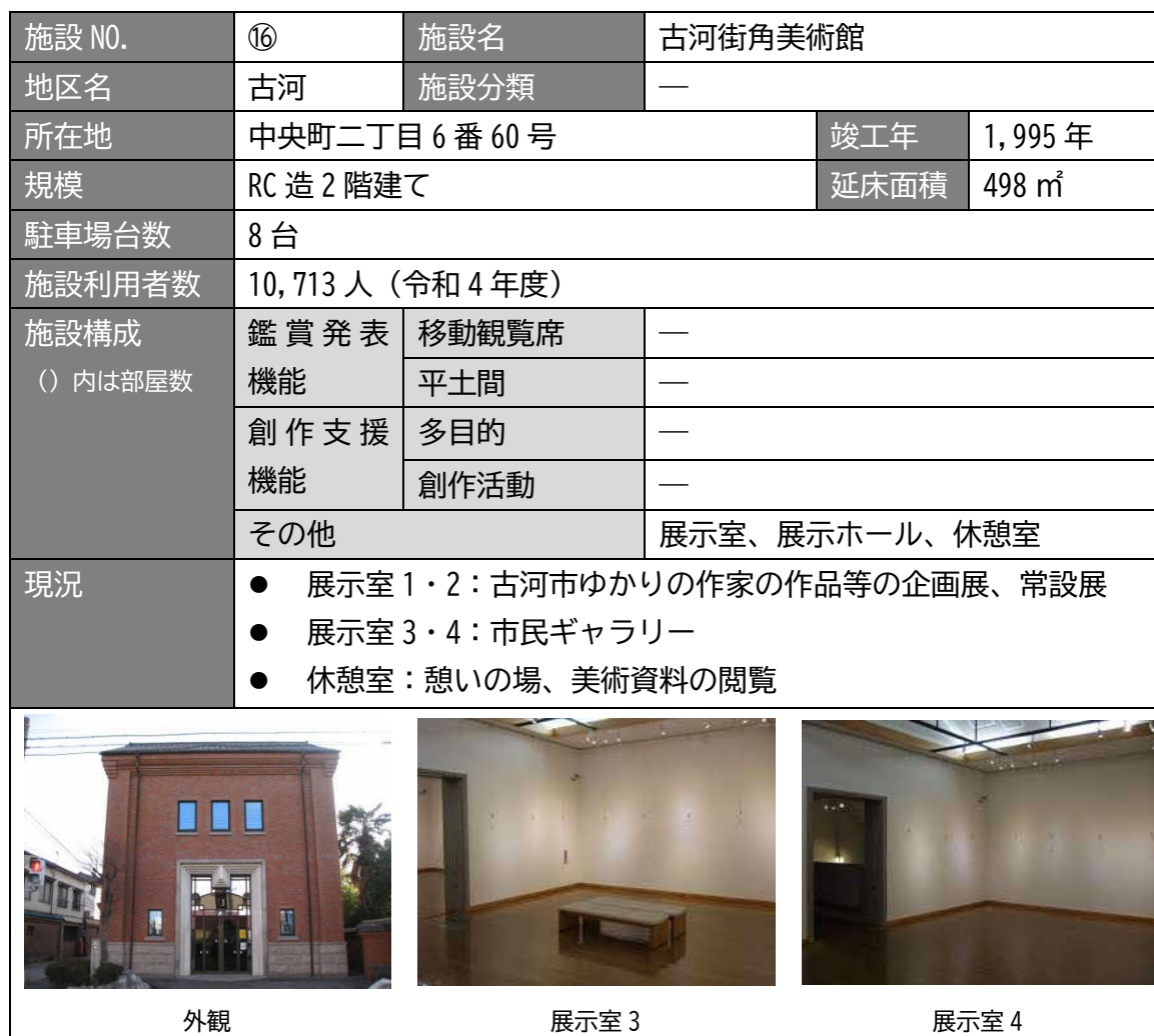
表 4.1 施設概要（古河街角美術館）

調査した 2 つの展示施設について、施設ごとの施設構成や利用形態を示す。 なお、諸室名称は、古河市公共施設適正配置基本計画に準じている。